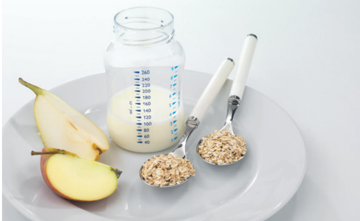
Copos de cereales finos (cocinados) + frutas + leche

Al final del primer año de vida se realiza la transición de comida para bebés a comidas de adultos.