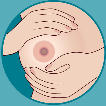
አፍኩስ አቢልኪ ጥብኪ ተንቐሳቐሶ