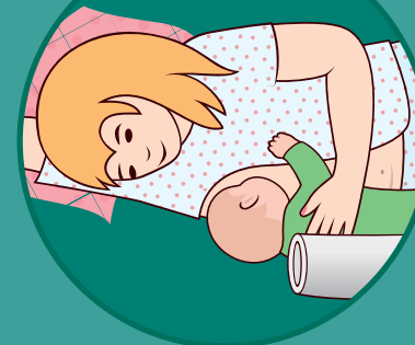
Amamentar em posição deitada