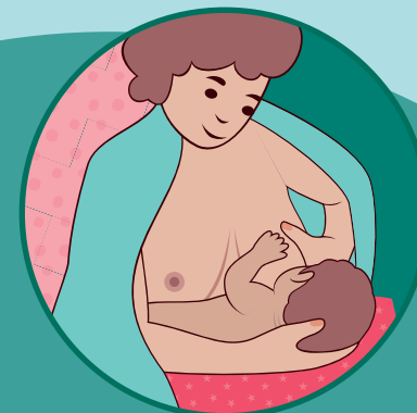
Posizione a culla modificata