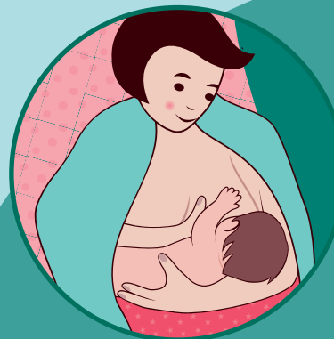
Posizione a culla