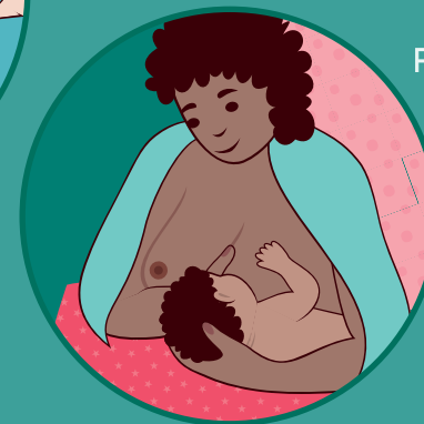
Position face à face